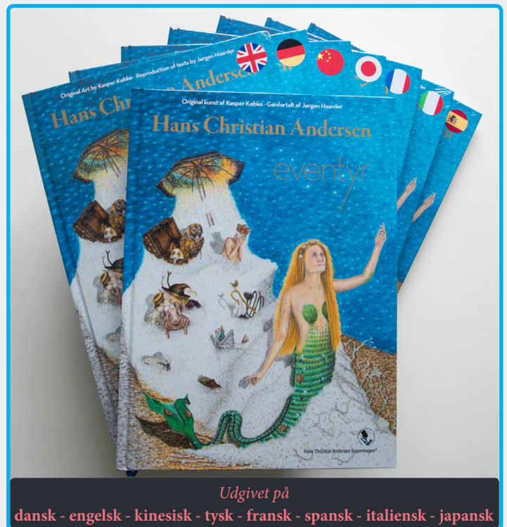
Udgivet på dansk - engelsk - kinesisk - tysk - fransk - spansk - italiensk - japansk